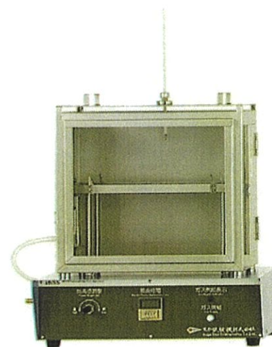
JIS D1201 水平燃燒試驗機