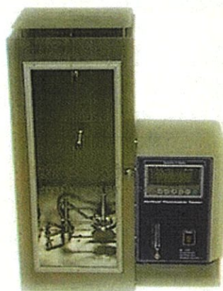
垂直燃燒試驗機 A-4法